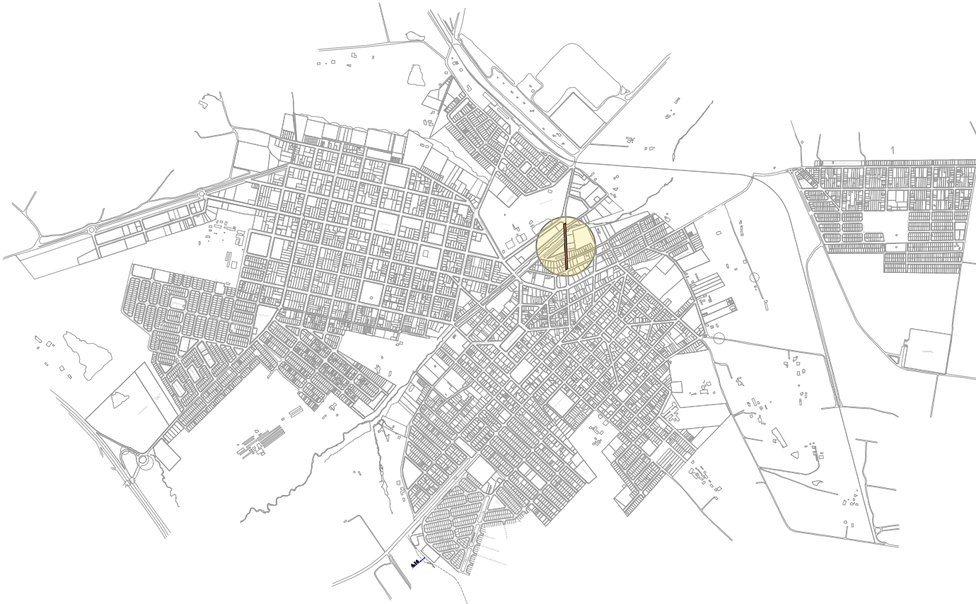
LOCALIZAÇÃO SEM ESCALA